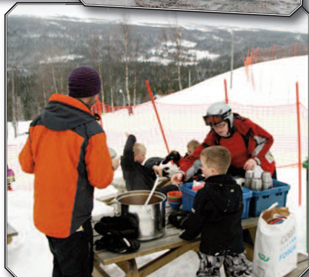
Bildserien överst på uppslaget visar några olika inslag från skolans verksamhet. Bilden ovan är just från en sådan läger- och skidvecka i fjällen som höll på att frysa inne i år.