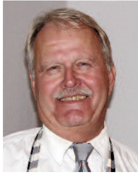
KM Broder Göthe Karsin.